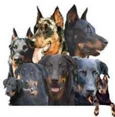
CLUB LES AMIS DU BEAUCERON

Si un chien ne peut malheureusement pas participer (blessure, décès ou autre), c'est le chien suivant, sélectionné, qui prend sa place. Le règlement national français fait fois.