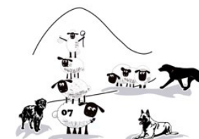
CTA 07 Chiens de Troupeaux Ardèche 07